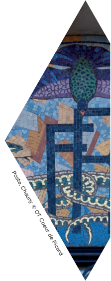
Porte Chauny