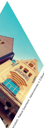
Berobert Palace Gourmont Valenciennes