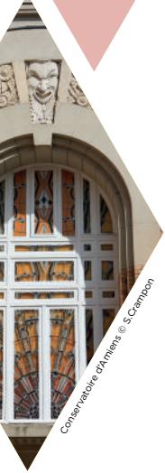
Conservatoire d'Amiens

De Saint-Quentin à Maubeuge, de Lille à Soissons, les portes d'édifices emblématiques ou méconnus s'ouvrent pour nos visiteurs. L'occasion de lever les yeux vers des façades exceptionnelles, de danser le charleston, d'entrer dans des églises aux splendides décors et de découvrir ou redécouvrir les collections des musées du territoire.