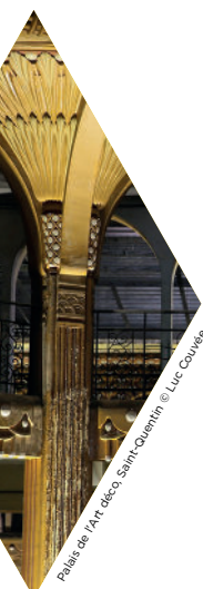
Palais de l'Art déco, Saint-Quentin