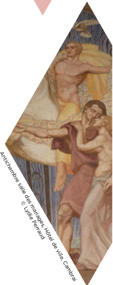
Antichambre salle des mariages, Hôtel de ville Cambrai