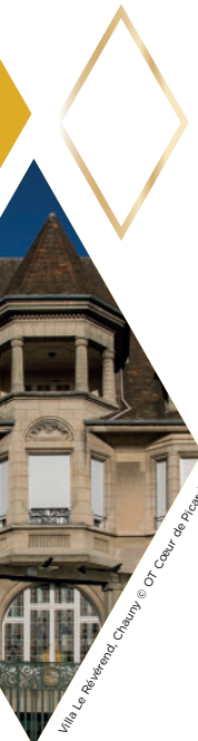
Villa Le Reverend Chauny