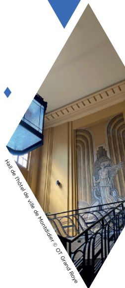
Hall de l'hôtel de ville de Hamamel