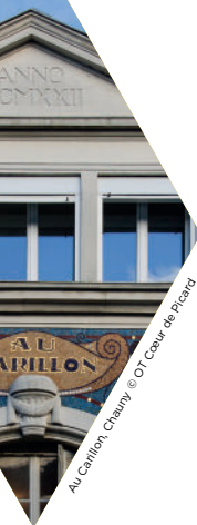
Au Carillon Chauny