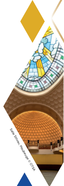
Salle Struett, Maubeuge